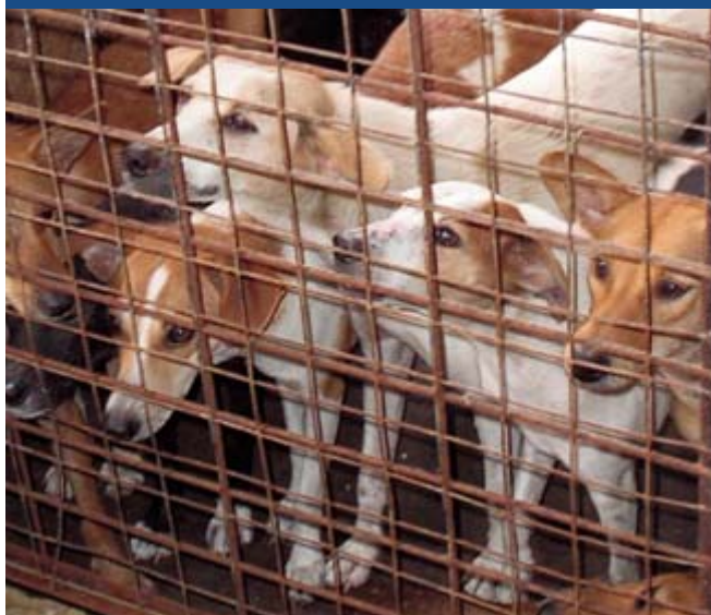
Perrera con condiciones de hacinamiento

Puede ser que, después de la evaluación, construir un albergue no sea la manera en la que a usted le será posible ayudar a la mayor cantidad de animales.